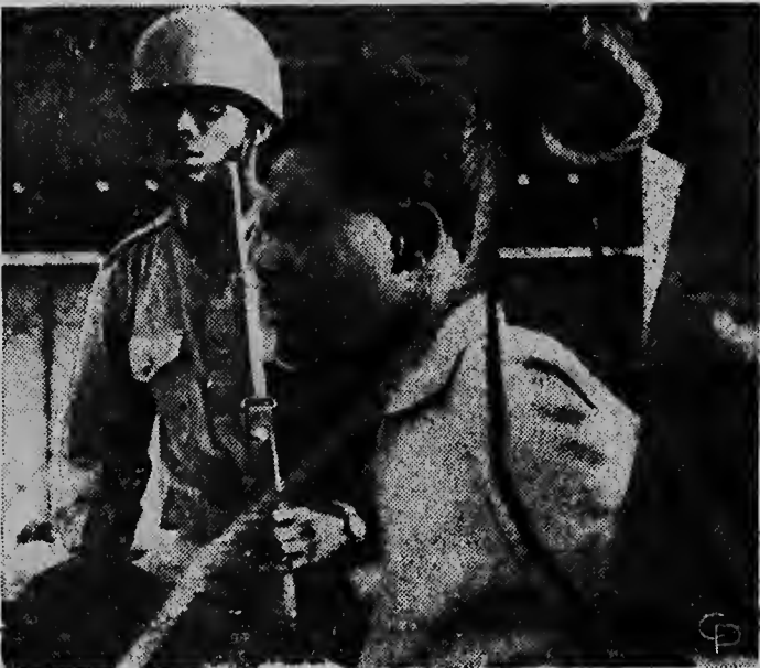
Nos ta mira aqui e homber asina significante di Congo, Premier Lumumba, comersando un calmo domina den su prison na Leopoldville.

HAVANA, 19 jan. — Ahera nochi tabata tin un demostracion na Havana dilanti di oficina dje compania nacionaliza di electricidad, pa protesta contra onslag di miembronan di personal y algun aspecto dje politiek di gobierno Cubano. Como 200 hende a tuma